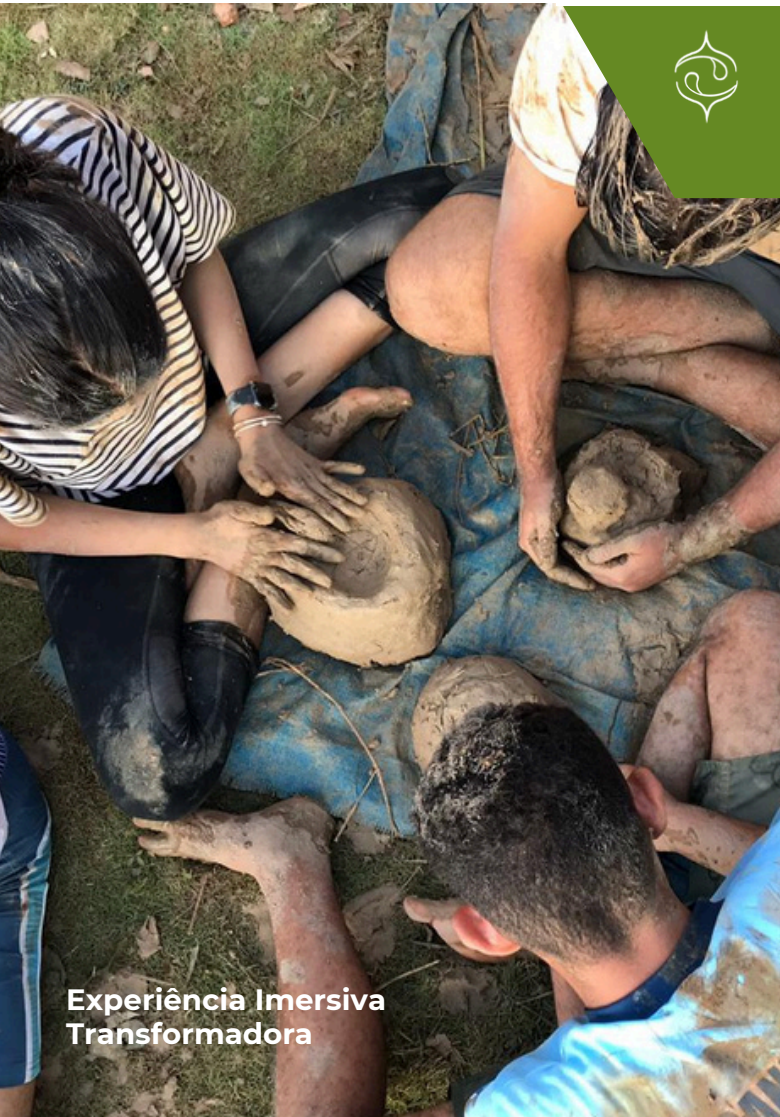
Experiência Imersiva Transformadora