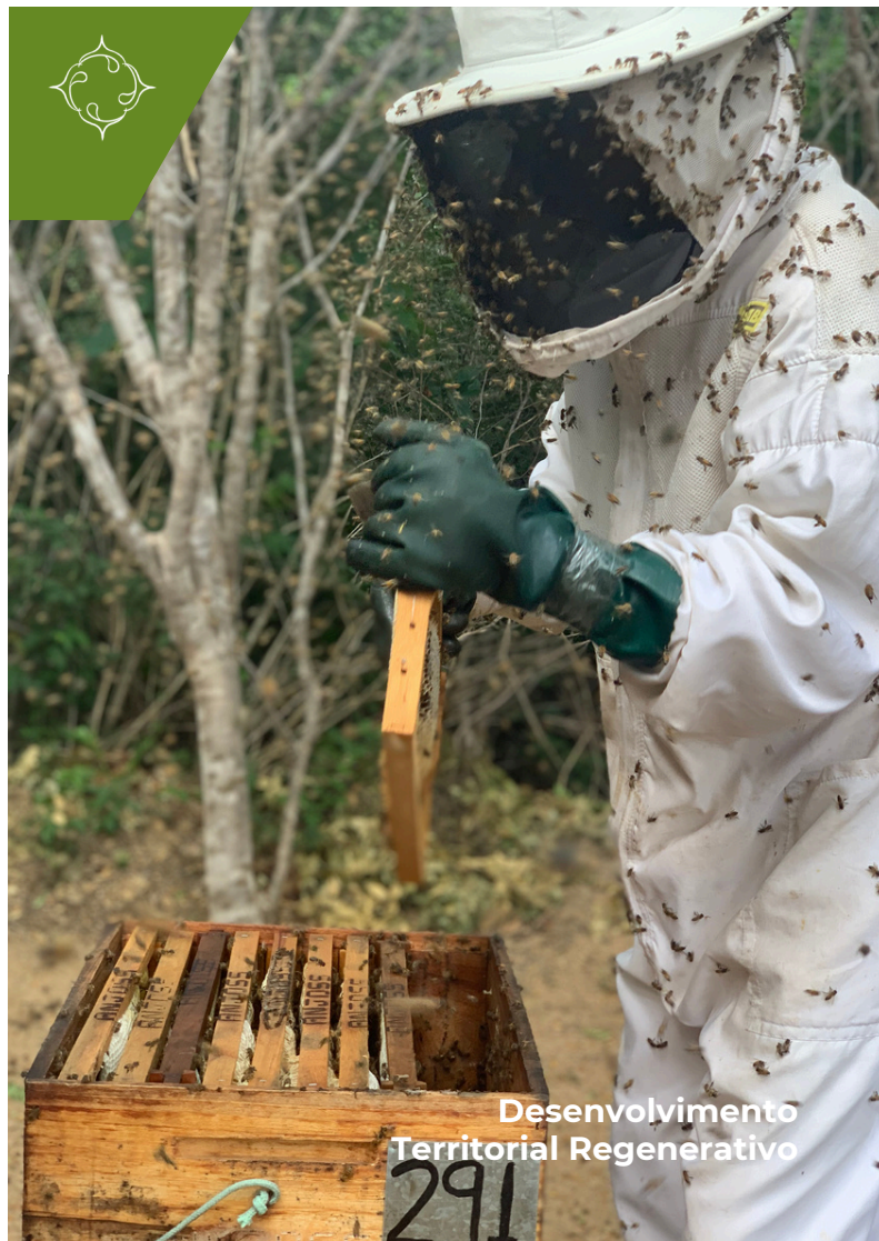
Desenvolvimento Territorial Regenerativo