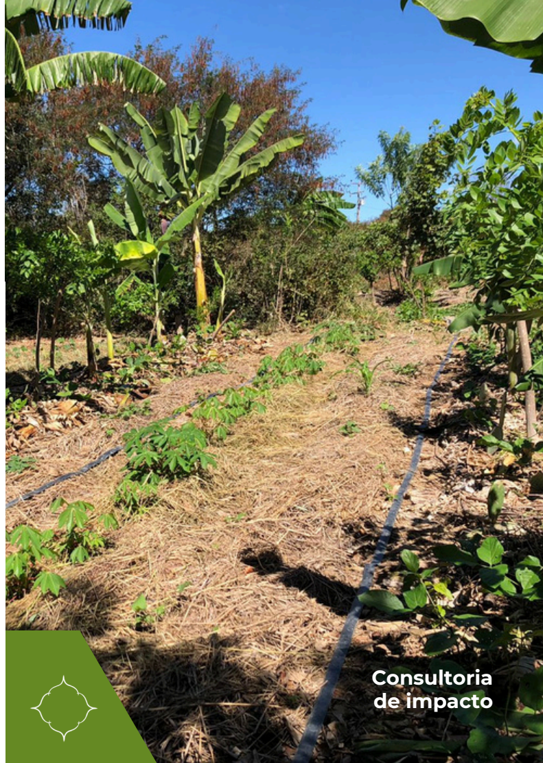
Consultoria de impacto