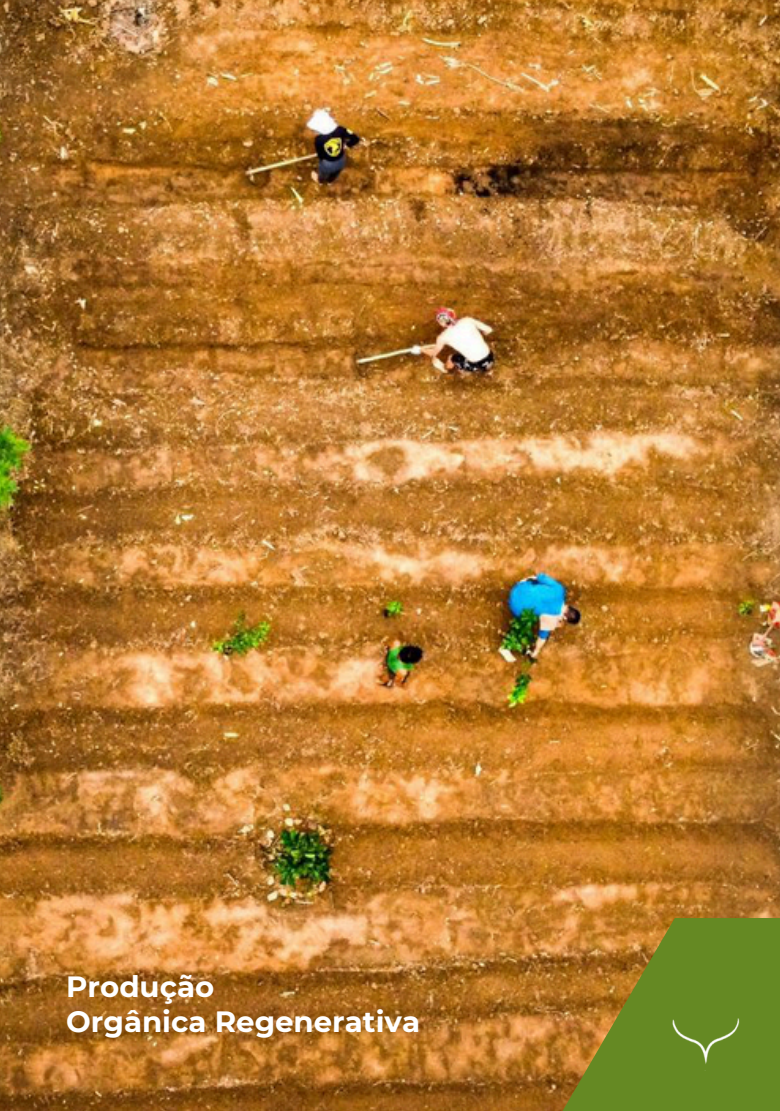
Produção Orgânica Regenerativa